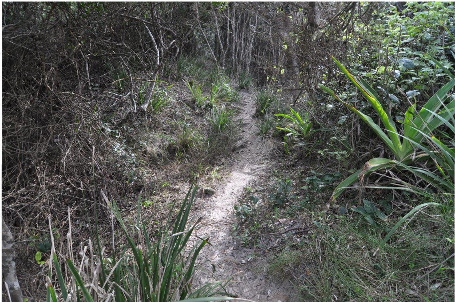
PHOTOGRAPHIC PLATE No. 2: Access path across gully. Boardwalk to board and chain accessway will transition at base of photo