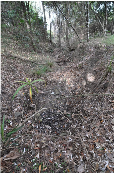
PHOTOGRAPHIC PLATE No. 3: Existing eroded minor gully to be rehabilitated - refer to Vegetation Management Plan (VMP)