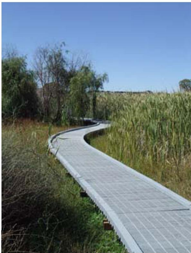
Boardwalk using Replas Enduroplank™