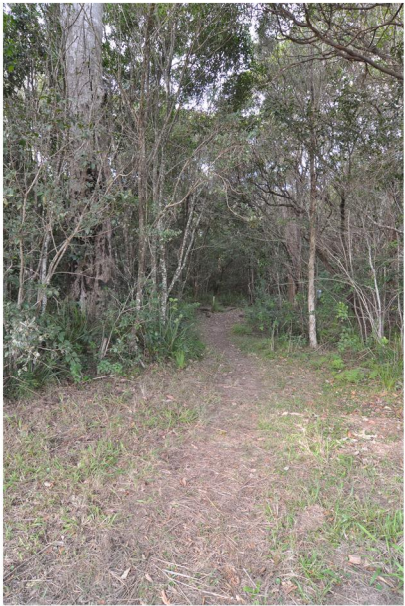
PHOTOGRAPHIC PLATE No. 6: Existing path entry into SEPP 26 Rainforest