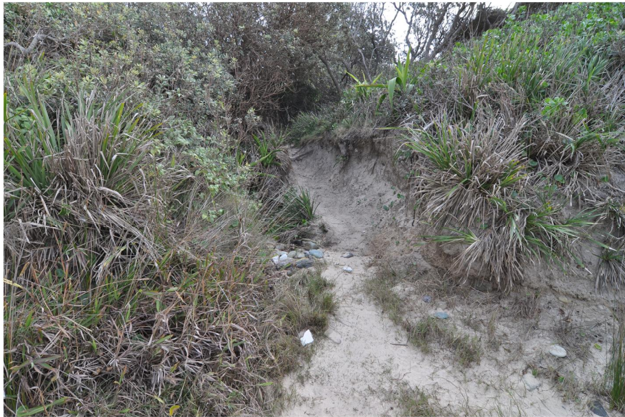
PHOTOGRAPHIC PLATE No. 1: Path access at beach. Some minor bank stabilisation required using Treemax Recover™ or equivalent and planting in accordance with Vegetation Management Plan (VMP)