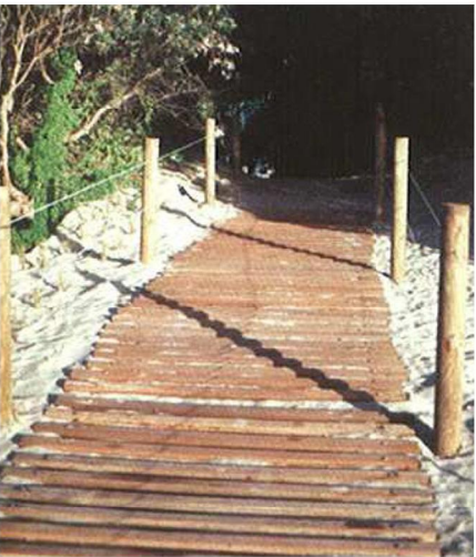
Board and chain accessway (Coastal Dune Management, NSW Government 2007)