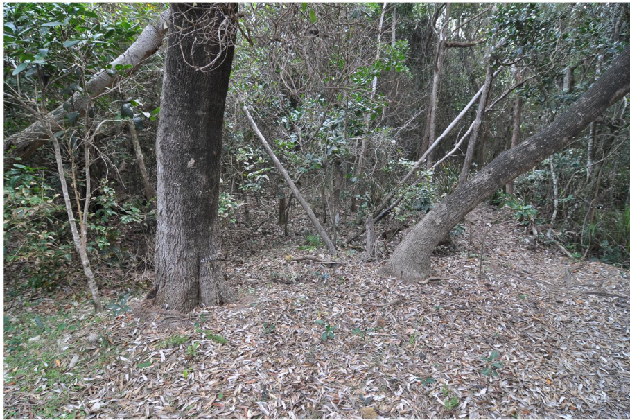
PHOTOGRAPHIC PLATE No. 4: Boardwalk to be aligned carefully between these two trees