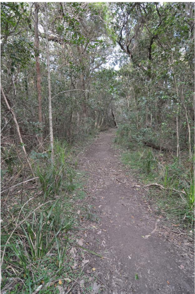
PHOTOGRAPHIC PLATE No. 5: Typical character and width of existing path access. The boardwalk is to be aligned along the path